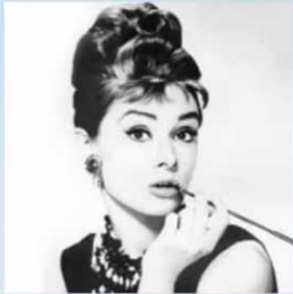
Audrey Hepburn - Breakfast at Tiffany's, 1961