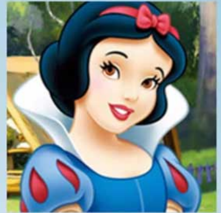
Blancanieves - Disney, 1938