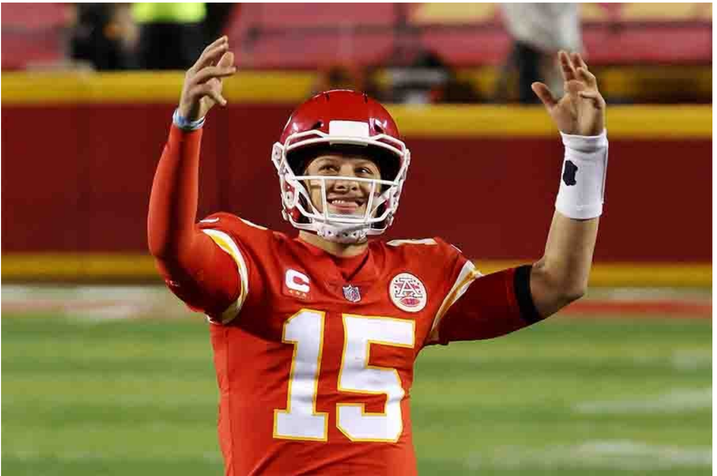
width="900" loading="lazy"> Fortalezas Patrick Mahomes