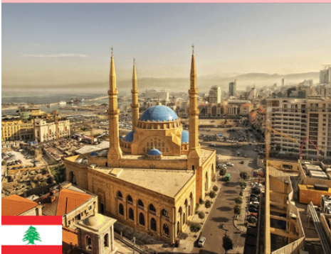
ENIGMAS DEL MEDIO ORIENTE: Un viaje a través de LÍBANO