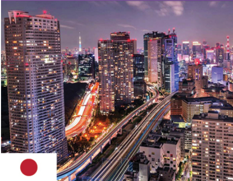
Conceptual Art journal and Video Story Telling - Tokyo - Kyoto