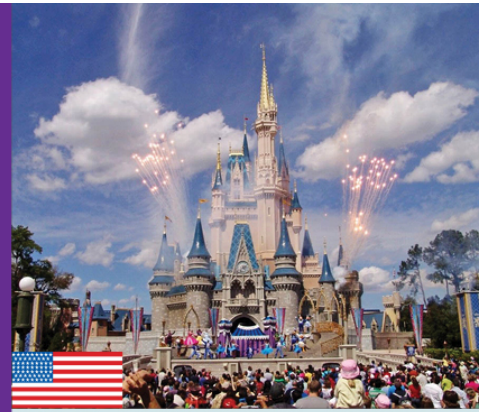
La magia de hacer magia