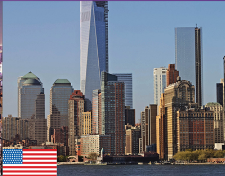
Conoce el mercado financiero más importante del mundo: Nueva York