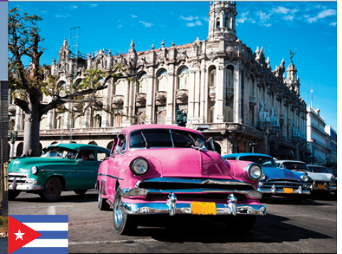
"CUBA: UN ENCUENTRO CIUDADANO A TRAVÉS DE LA DIVERSIDAD CULTURAL"