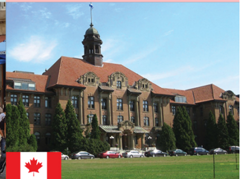
Montreal: Diálogo para el líderazgo John Abbott College