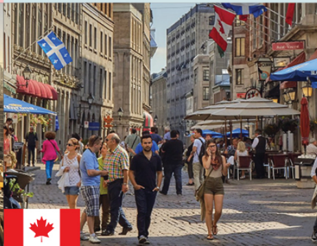
Montreal: viviendo la biculturalidad