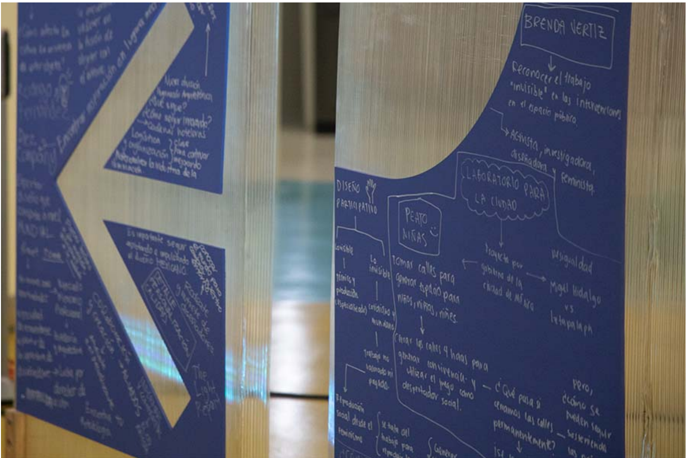
Inspiración en artefactos de la calle