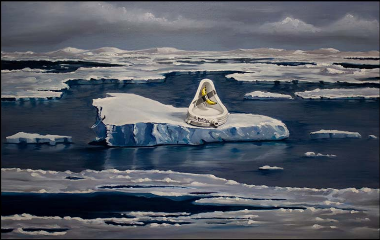
"SURVIVAL KIT " 2020 óleo sobre tela 50x80 cm Selección London Art Biennale

/> width="900" loading="lazy"> Las pinturas que vivirán en la Luna