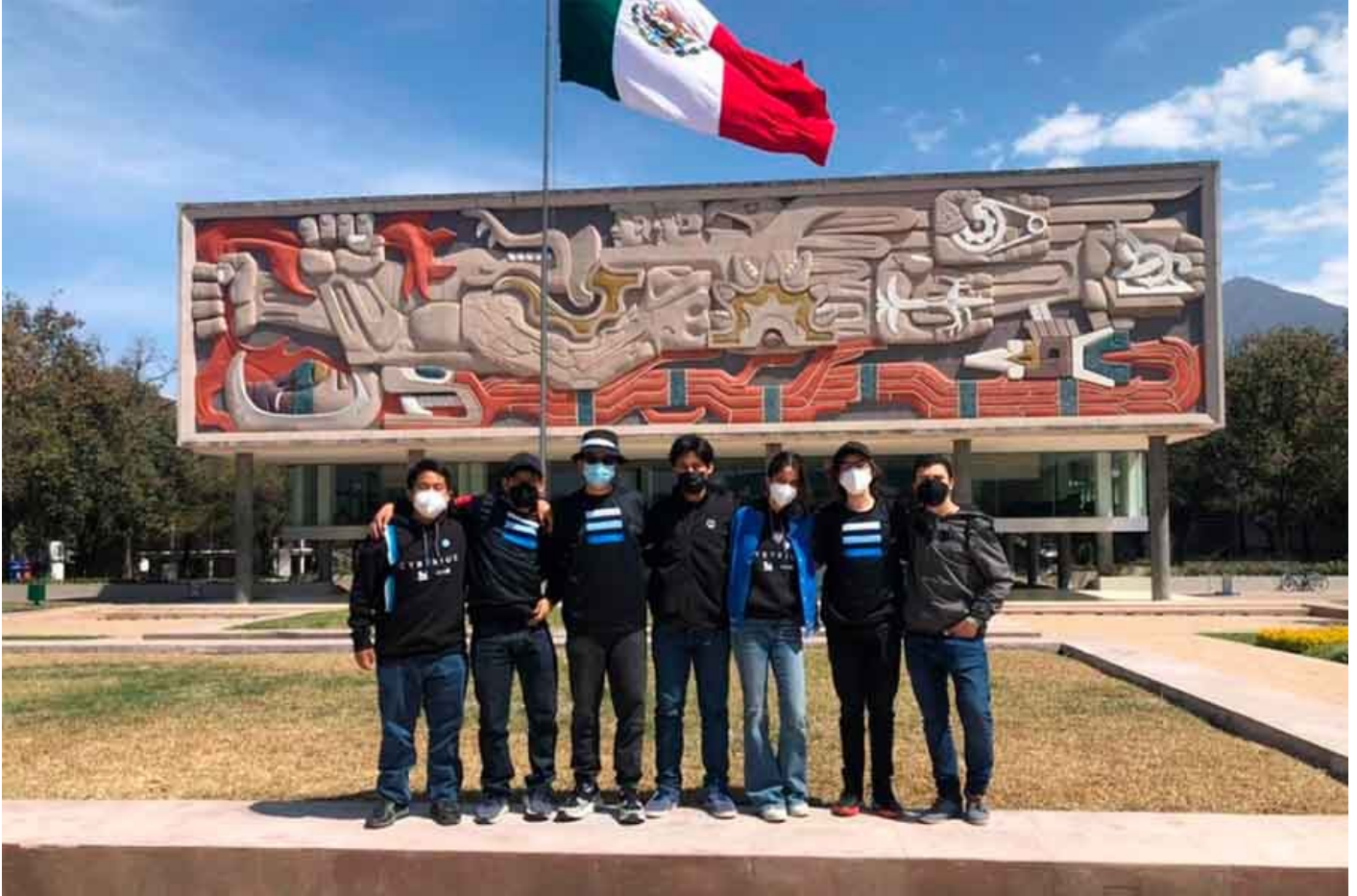
width="900" loading="lazy"> Chiapas y Santa Catarina unidos

“Fue una experiencia increíble. Tuvimos convivencia con alumnos y asesores de otros estados. Fue una competencia muy reñida pero nunca se perdió el compañerismo”.